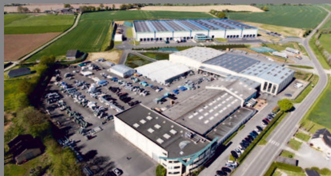
CELLOPLAST - BALLÉE - FRANCE