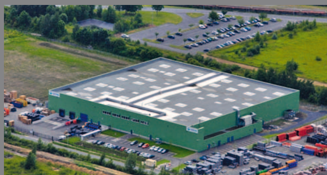
NORTENE TECHNOLOGIES - LOMME - FRANCE