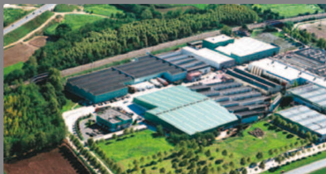
INTERMAS NETS - LLINARS DEL VALLÈS (barcelona) SPAIN