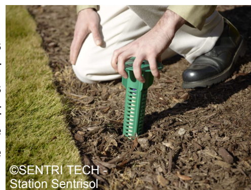
Station Sentrisol

Les stations Sentrisol sont placées par les applicateurs professionnels certifiés par SENTRI TECH ; elles sont contrôlées régulièrement pour s'assurer de leur action permanente. Lorsque des termites ouvriers rencontrent une station Sentrisol lors de leur exploration, ils consomment l'appât qu'elle contient et contaminent leurs congénères par échange de nourriture, lesquels sont également attirés par les phéromones de pistes que les éclaireurs auront laissé pour signifier une bonne source de nourriture.