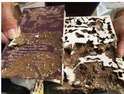
Dégâts termites sur des livres

Ils peuvent ainsi continuer leur travail de sape à l'abri des regards... jusqu'à destruction complète. Structures de la maison et équipements : rien ne leur résiste, y compris les matériaux qu'ils ne consomment pas, mais qu'ils traversent sans hésiter pour atteindre la cellulose dont ils sont friands. Ce n'est donc pas seulement le bois qu'ils endommagent, mais aussi le plâtre ou encore des gaines électriques ! Et tout cela à votre insu ! En toute logique, la lutte contre les termites doit donc se baser sur la prévention. Lorsque l'on réside dans une région termitée, il convient en effet d'anticiper leur arrivée. La méthode SENTRI TECH HD propose ainsi une surveillance active, avec élimination de la colonie dès le premier contact. Cette méthode, dure avec les termites et douce pour l'environnement, a pour avantage d'être infaillible et d'éviter tout dommage. Mieux vaut prévenir que guérir...