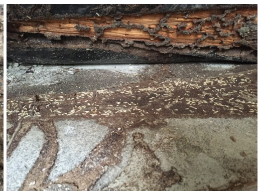
Galeries empruntées par des termites