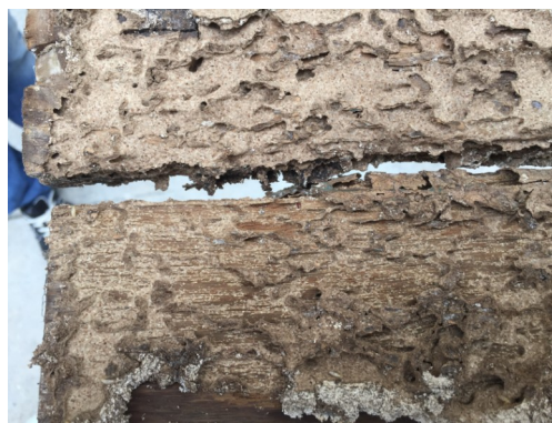
Dégâts termites