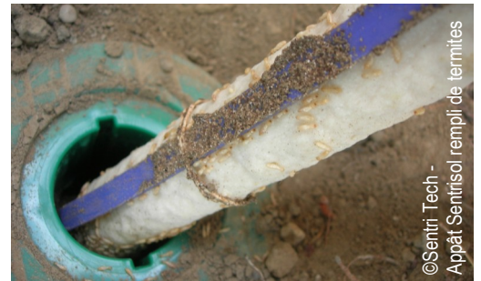
Appât Sentrifisol rempli de termites

Curative, la première étape consiste donc à enrayer l'infestation . Vient ensuite l'étape de protection active , lors de laquelle l'appât reste présent dans les stations, même une fois les termites éliminés. Cette présence permanente de l'appât est justement là pour éviter tout risque de ré-infestation par une nouvelle colonie. Si des termites s'approchent à nouveau, ils vont spontanément consommer l'appât et la colonie sera contaminée dès le premier contact, puis détruite. Les applicateurs autorisés SENTRI TECH des entreprises Lorillou et TTBR vont alors effectuer des contrôles réguliers afin de vérifier si les stations sont, ou non, « réinvesties » par les termites.