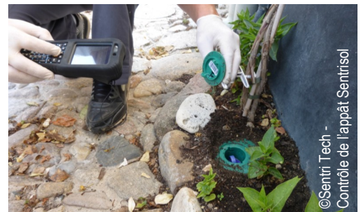
Contrôle de l'appât Sentrifisol