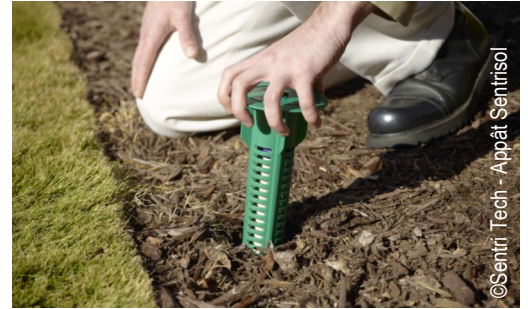
Appât Sentrifisol

Les pièges retenus pour éradiquer les termites contiennent le Recrute HD, l' appât Haute densité de SENTRI TECH . Cet appât, commercialisé depuis janvier 2015, est à ce jour la plus récente évolution qu'a connue la méthode SENTRI TECH, et qui a depuis très largement prouvé son efficacité . Seules les deux entreprises certifiées par le FCBA - Lorillou et TTBR - pouvaient appliquer cette méthode curative par pièges. La zone infestée représente une superficie de 24 000 m 2 , mais comme le foyer peut continuer à se déplacer et à proliférer vers les extérieurs, il fallait donc agir rapidement et efficacement. L'installation des pièges a été réalisée en une semaine. Au cimetière de la Rossignolette, 300 stations ont été posées et 50 à celui de Saint-Maurice. Il s'agit-là d'un nombre très important de stations, si on le compare avec celui nécessaire pour une maison infestée, de l'ordre de 20 stations en moyenne, ou pour une école (90 stations).