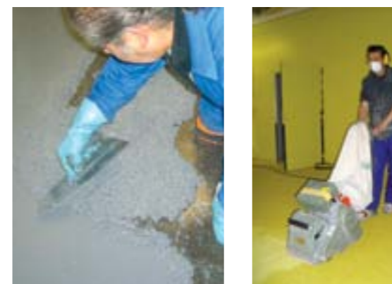
Coulage d'un mortier