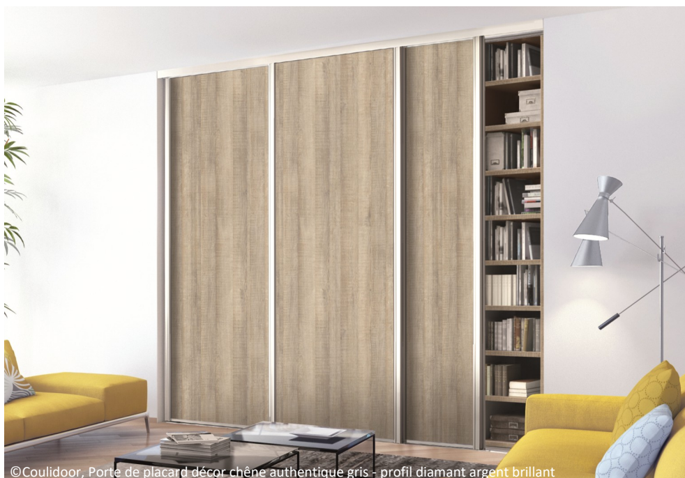
©Coulidoor, Porte de placard décor chêne authentique gris - profil diamant argent brillant

Vous laissez vos portes de placards toujours ouvertes ou entrebâillées ? Coulidoor a la solution. Le spécialiste fabricant de portes de placard , dressings, verrières et séparations de pièces, a lancé la nouvelle version Coulisoft 2.0 . Cette innovation était à découvrir au dernier salon ARTIBAT. Elle sera disponible dans tous les négoce à partir de juillet.