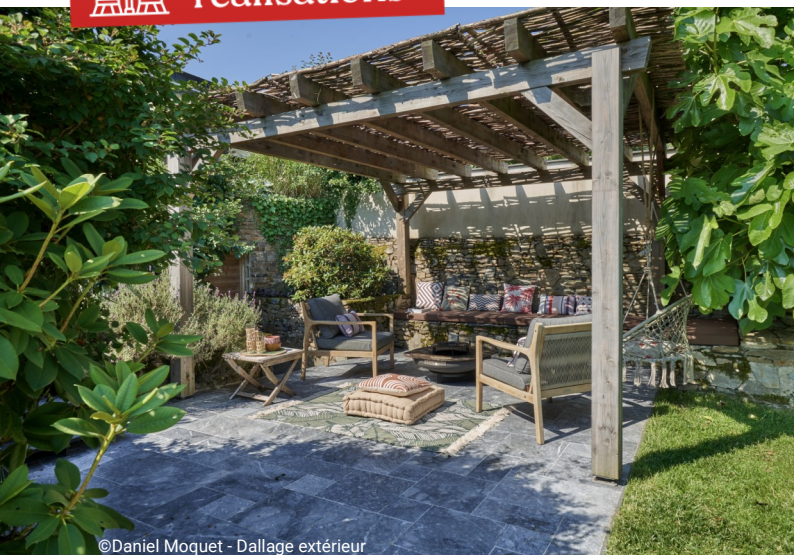
Dallage extérieur