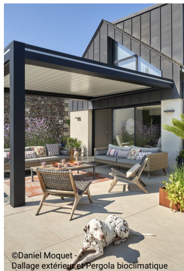
Dallage extérieur et Pergola bioclimatique