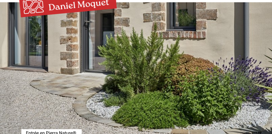
Entrée en Pierra Nature®