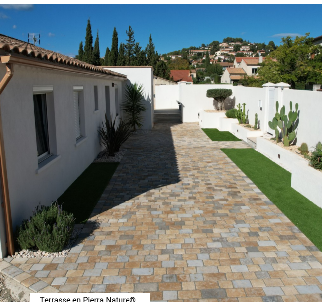
Terrasse en Pierra Nature®