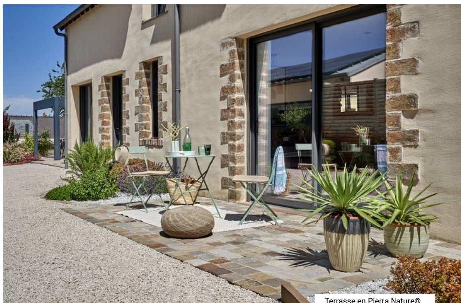
Terrasse en Pierra Nature®

Spécialistes des aménagements extérieurs depuis de nombreuses années, les réseaux Daniel Moquet accompagnent les particuliers dans la réalisation de leurs projets : cours, allées, terrasses, pergolas, clôtures, portails et entretien des espaces verts. Avec plus de 400 entrepreneurs paysagistes répartis dans toute la France, ils prennent en charge l'intégralité des projets, du conseil à la réalisation , pour créer des extérieurs beaux et fonctionnels.