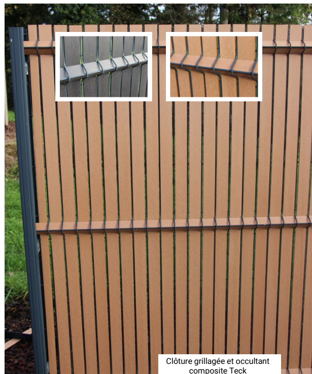
Clôture grillagée et occultant composite Teck