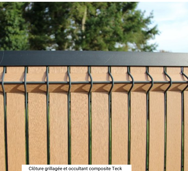
Clôture grillagée et occultant composite Teck