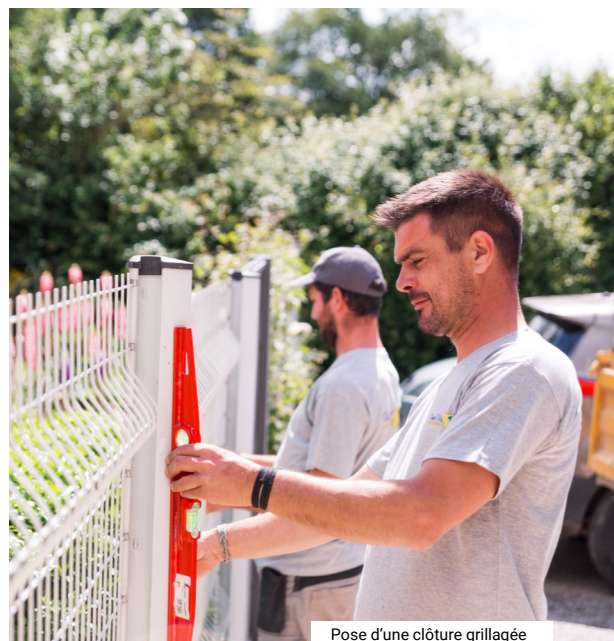
Pose d'une clôture grillagée