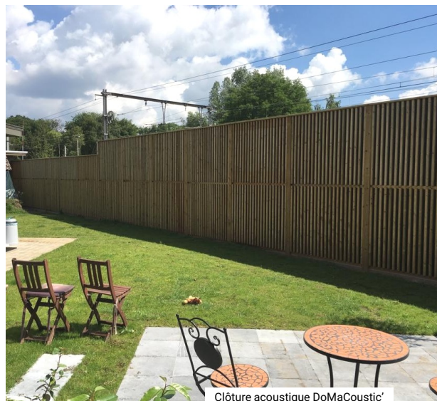
Clôture acoustique DoMaCoustic'