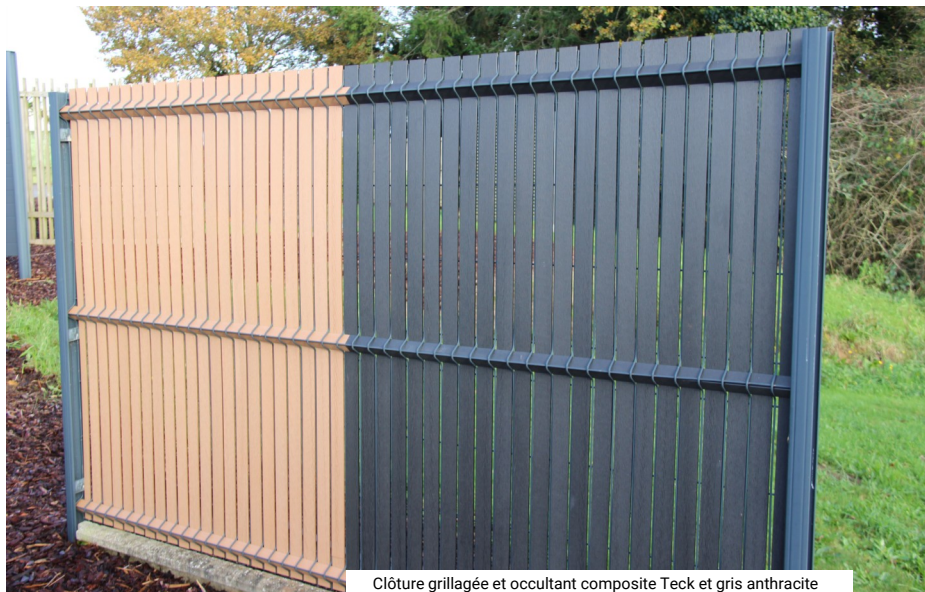
Clôture grillagée et occultant composite Teck et gris anthracite

Depuis cinq ans, le réseau Daniel Moquet , fort de plus de 400 entrepreneurs répartis dans toute la France, se spécialise dans l'installation de portails, clôtures, carports et pergolas. Ce savoir-faire s'inscrit en complément de leur expertise reconnue en revêtements extérieurs, offrant une solution globale pour aménager et sécuriser les extérieurs des propriétés. Leur engagement envers la qualité inclut la garantie d'une fabrication française ou européenne , valorisant le savoir-faire avec des équipes locales et une production respectueuse de l'environnement.