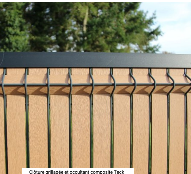
Clôture grillagée et occultant composite Teck