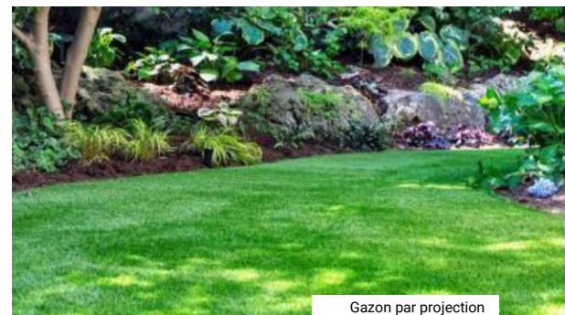
Gazon par projection