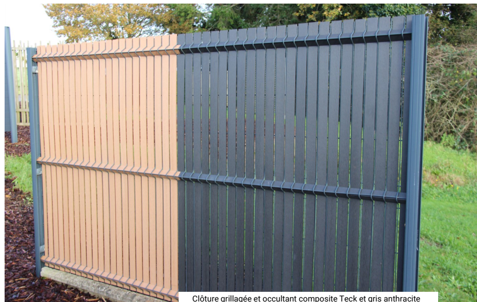
Clôture grillagée et occultant composite Teck et gris anthracite