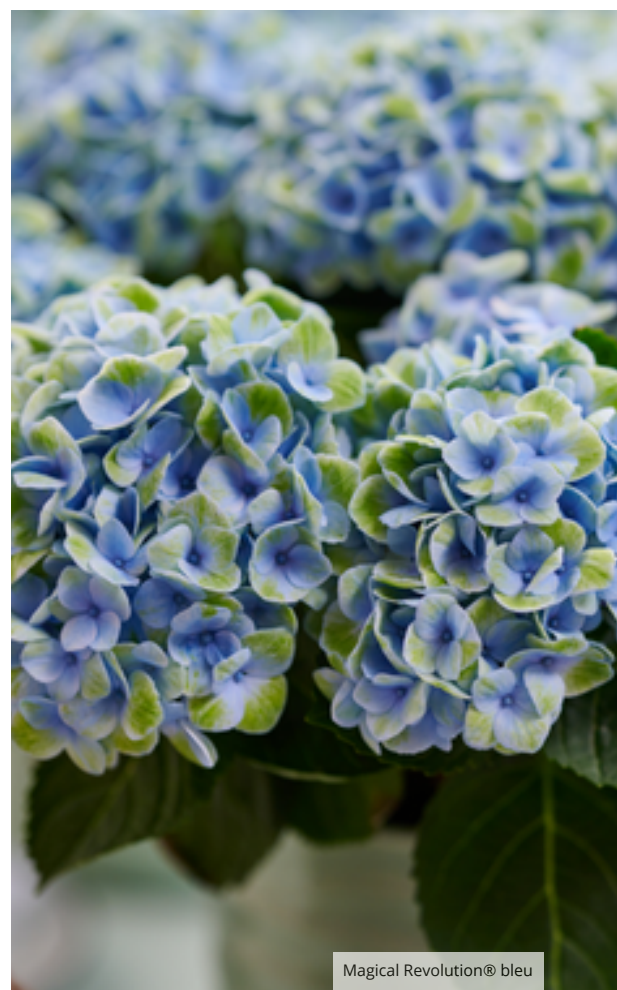
Magical Revolution® bleu

La particularité des Hortensias Magical® réside dans leur floraison évolutive , offrant un spectacle changeant au fil des saisons . Avec une période de floraison record de 150 jours pour les variétés Outdoor, ces hortensias accompagnent les jardiniers de la douceur printanière jusqu'aux derniers jours d'automne , établissant une référence inégalée sur le marché.