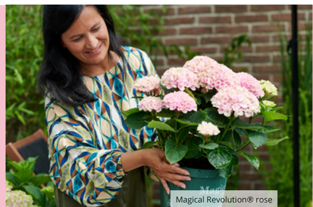
Magical Revolution® rose