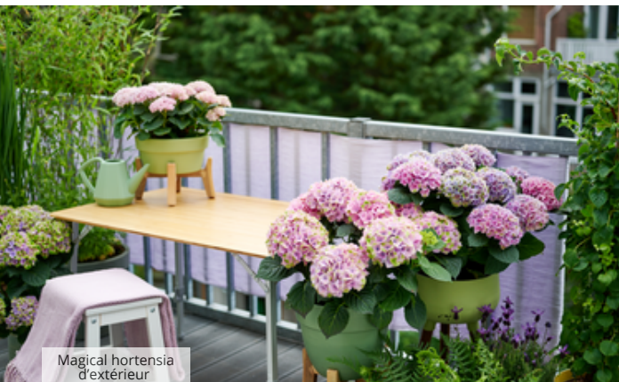
Magical hortensia d'extérieur