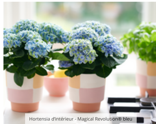
Hortensia d'intérieur - Magical Revolution® bleu