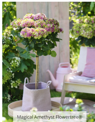
Magical Amethyst Flowertree®