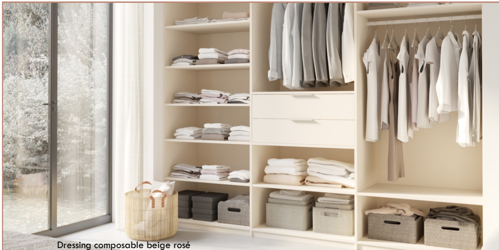
Dressing composable beige rosé

À découvrir chez tous les revendeurs installateurs AD