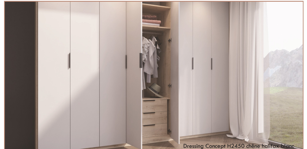
Dressing Concept H2450 chêne halifax blanc