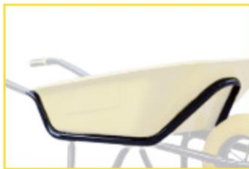
Arceau de sécurité Ø32mm pour un maintien parfait de la caisse