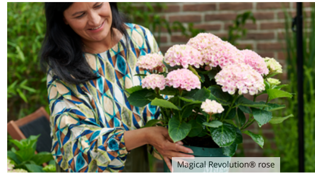
Magical Revolution® rose

Avec l'hortensia Magical, inutile d'avoir la main verte ! Placez-le dans un grand pot avec des hydro-granulés pour assurer un bon drainage de l'eau excédentaire. Il est temps d'arroser la plante lorsque les feuilles se ramollissent. Durant la floraison , ajouter deux à trois fois de la nourriture pour plantes . Ces robustes hortensias résistent à l'hiver et peuvent rester dehors toute l'année. Pour plus de conseils pratiques , consultez notre canal Youtube ou le site www.magicalhydrangea.com .