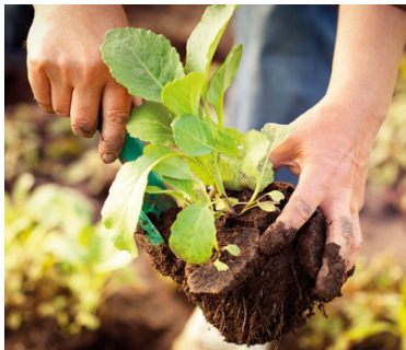
Communiqué de presse, le 19 mars 2025