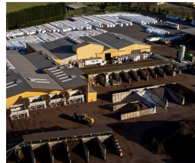
Rubrique : ETI / végétal