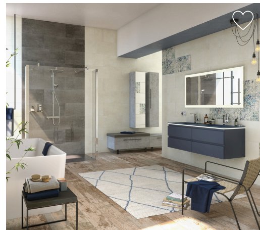
Rubrique : projet / salle de bains