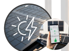
KIT SOLAIRE INCLUS 2KWC