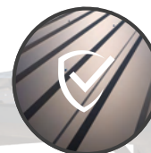
TOITURE QUALITATIVE EN BAC ACIER ET VIS CONFORME DTU