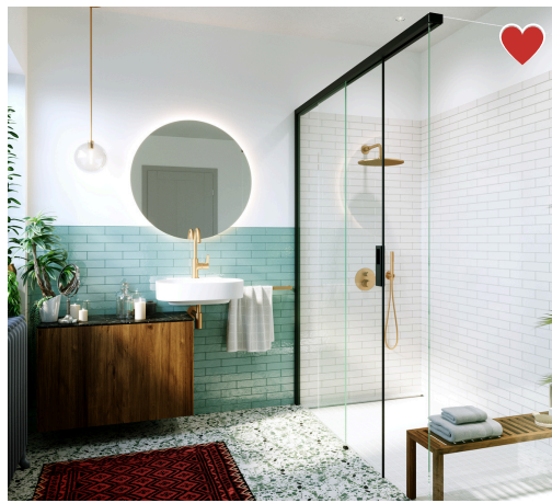
Communiqué de presse, le 25 juin 2025