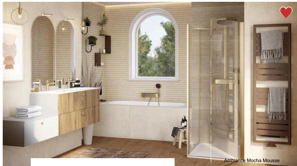
Ambiance Mocha Mousse

BAIGNOIRE Baignoire à jacuzzi Baignoire à jacuzzi Baignoire à jacuzzi Baignoire à jacuzzi