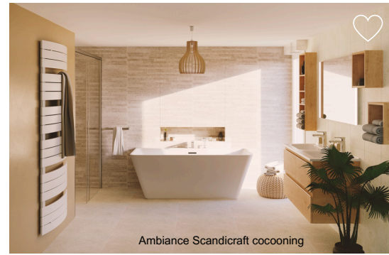
Ambiance Scandicraft cocooning