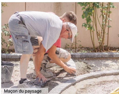
Maçon du paysage

Ces métiers, en rapport avec la nature , sont recherchés dans les parcours de reconversion. Ils attirent par exemple les personnes qui ont travaillé pendant des années dans des bureaux, en industrie ou d'autres, qui souhaitent se réorienter pour exercer un métier manuel et créatif .