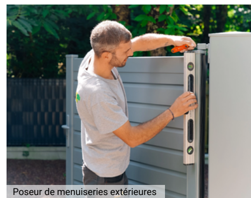
Poseur de menuiseries extérieures