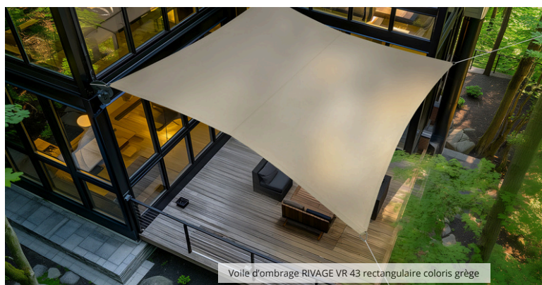
Voile d'ombrage RIVAGE VR 43 rectangulaire coloris grège

De fabrication française, la gamme Rivage s'inscrit pleinement dans une démarche d'innovation durable. Conçus à partir de matières recyclables, ces voiles présentent un faible impact carbone, répondant ainsi aux exigences environnementales les plus strictes. Jardiline® prouve une fois de plus son leadership dans l'éco-conception de produits de décoration extérieure.