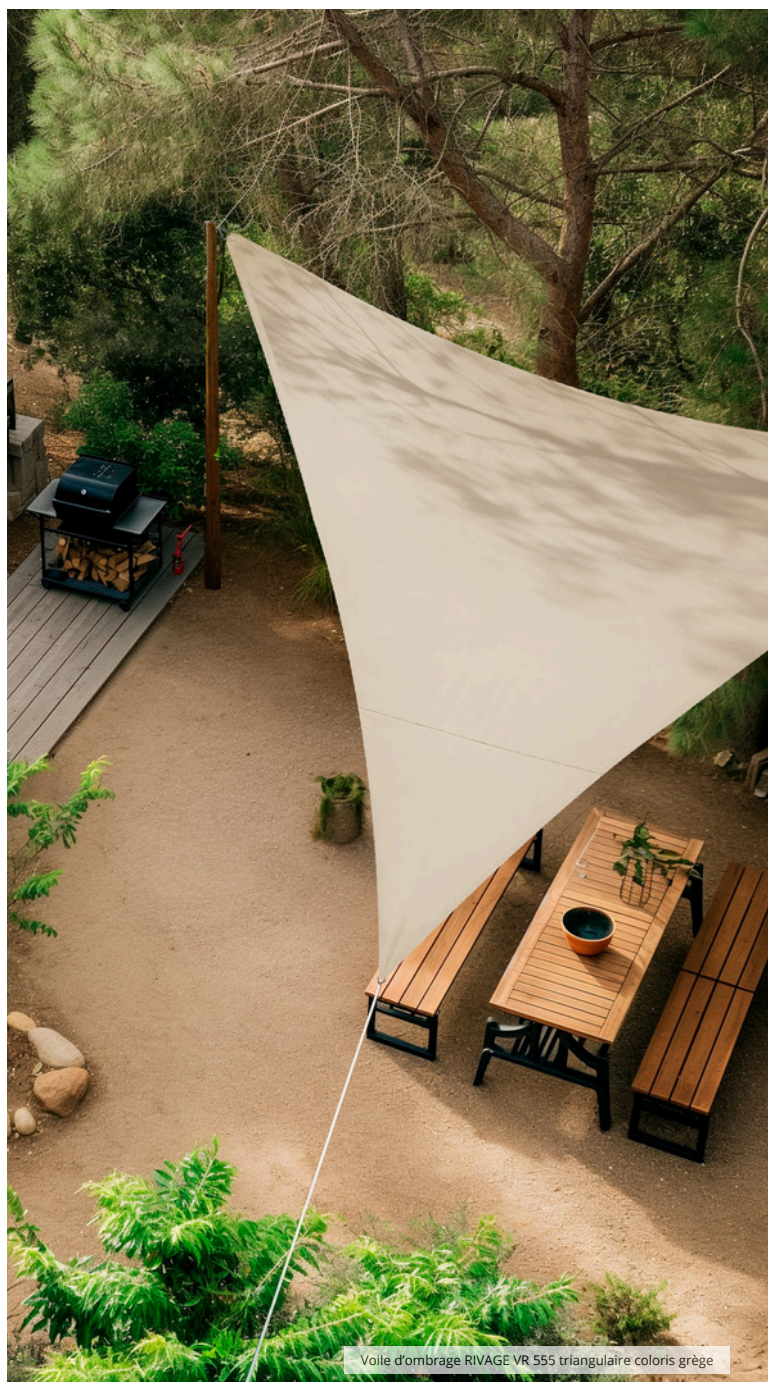
Voile d'ombrage RIVAGE VR 555 triangulaire coloris grège