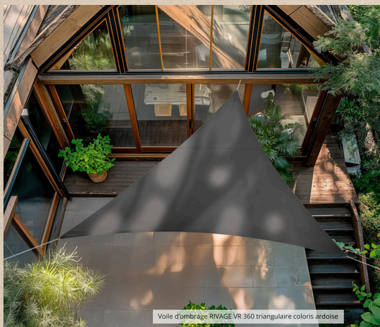
Voile d'ombrage RIVAGE VR 360 triangulaire coloris ardoise