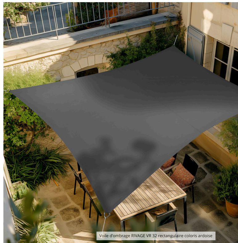
Voile d'ombrage RIVAGE VR 32 rectangulaire coloris ardoise

Ces produits sont disponibles en jardineries, en grande distribution et vendus sur le site www.le-coin-deco.fr .