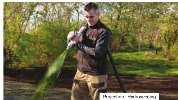
Projection - Hydroseeding