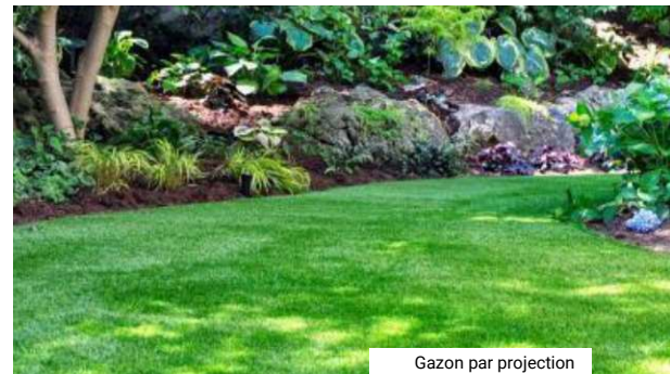
Gazon par projection