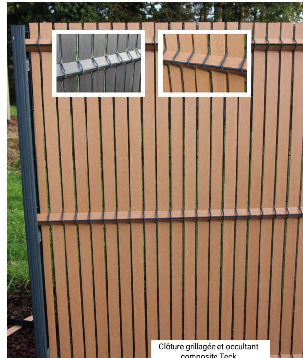
Clôture grillagée et occultant composite Teck

Cette clôture , fabriquée à partir de bois composite et de métal, offre une combinaison de sécurité et de qualité , tout en s'intégrant parfaitement dans le cadre naturel de la maison.