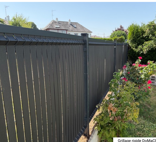
Grillage rigide DoMaClo' à plis + Occultant composite Gris Anthracite (Ent. Melot)

Cette clôture , fabriquée à partir de bois composite et de métal, offre une combinaison de sécurité et de qualité , tout en s'intégrant parfaitement dans le cadre naturel de la maison.