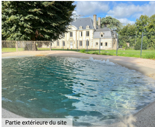
Partie extérieure du site