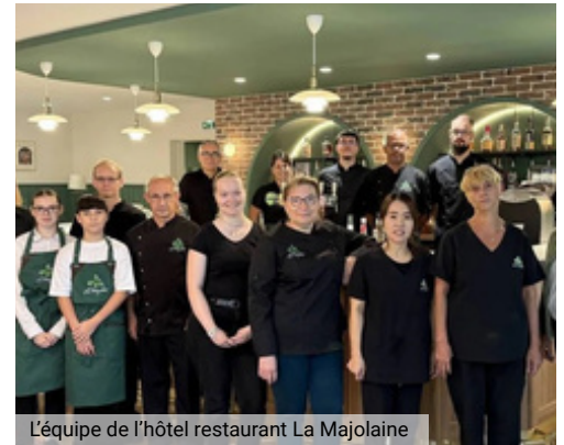
L'équipe de l'hôtel restaurant La Majolaine