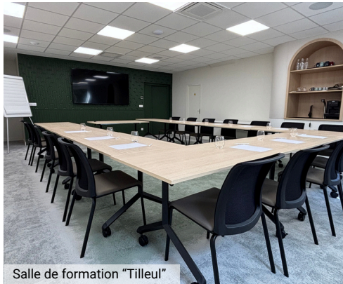
Salle de formation "Tilleul"