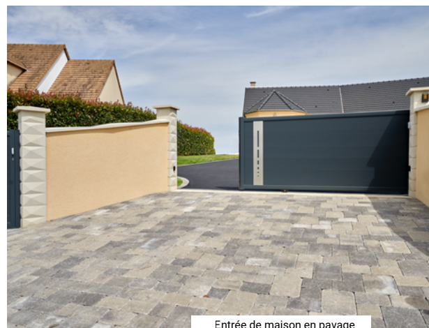
Entrée de maison en pavage