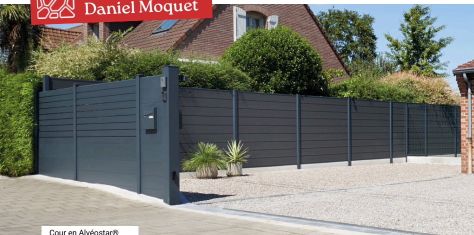
Cour en Alvéostar®