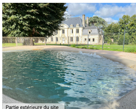
Partie extérieure du site