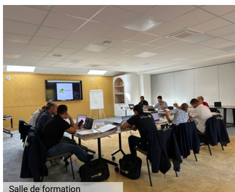
Salle de formation