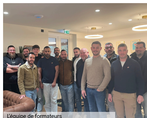
L'équipe de formateurs