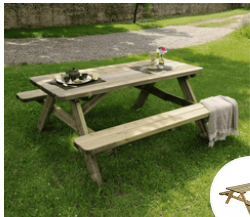
Table de pique-nique en bois 6 personnes ROBUSTE

Prix public généralement constaté : 299,00 €