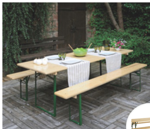
Table de jardin et bancs pliables 6 à 8 personnes - Brasseurs

Prix public généralement constaté : 339,00 €