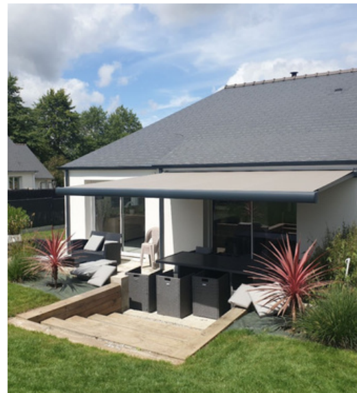
• Store banne DoMSun' Glomel