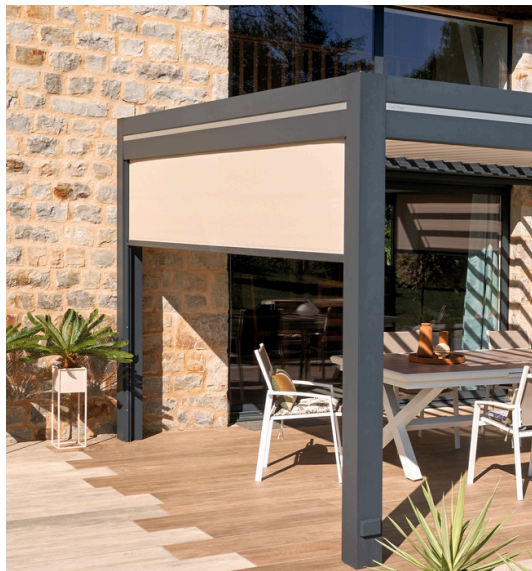
• Pergola bioclimatique Prélude Harmony