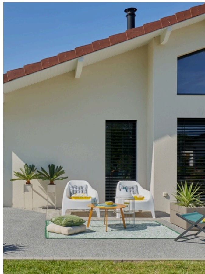
• Terrasse en Hydrostar gris et en dallage