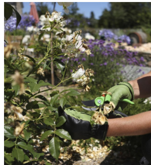
• Taille du rosier