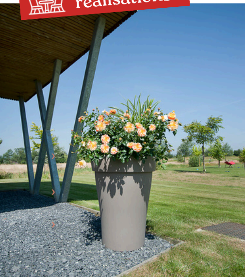
• Le Rosier Daniel Moquet