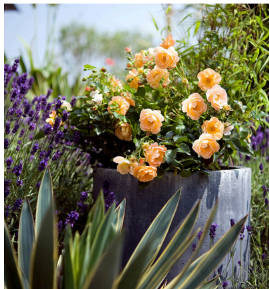
• Le Rosier Daniel Moquet