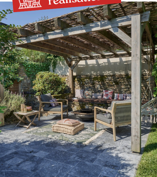
• Pergola en bois DoMaNatur' Albizia