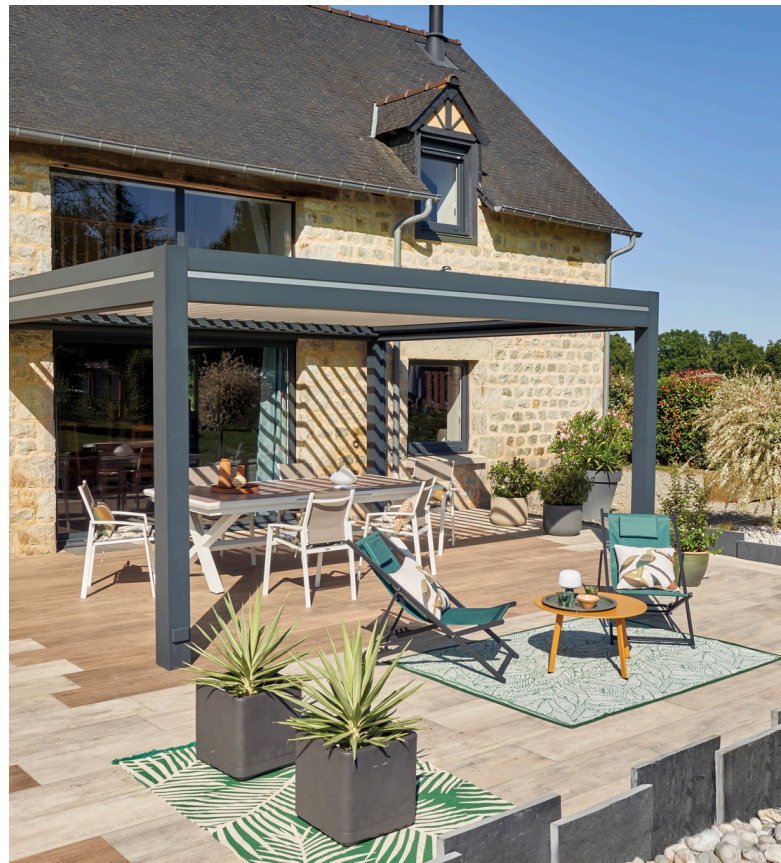
• Terrasse dallage et Pergola bioclimatique Prélude Harmony

NON , il existe différentes techniques qui permettent de ne pas avoir à faire de dalle béton avant de poser un dallage extérieur , et qui évite que la terrasse ne fissure, comme la pose sur plots ou sur gravette.