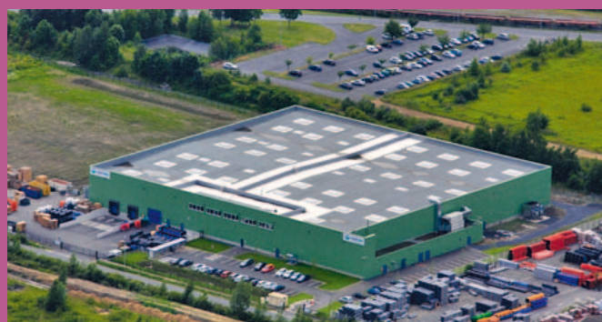
NORTENE TECHNOLOGIES - LOMME - FRANCE