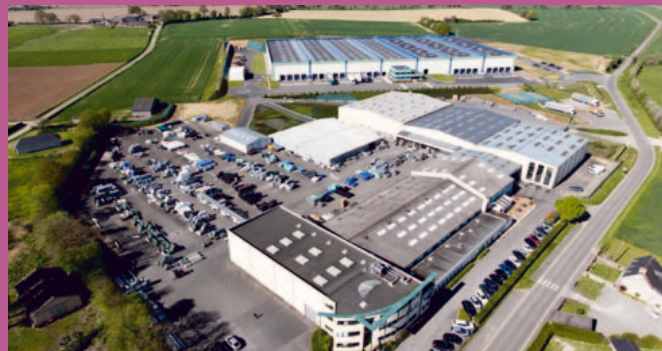
CELLOPLAST - BALLÉE - FRANCE