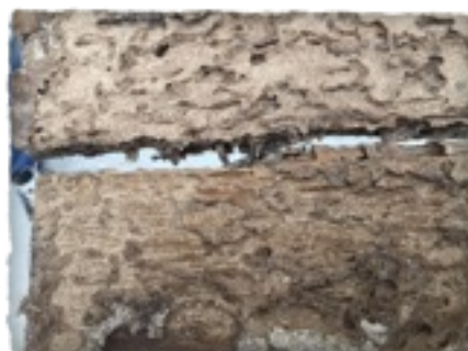
Dégât termites