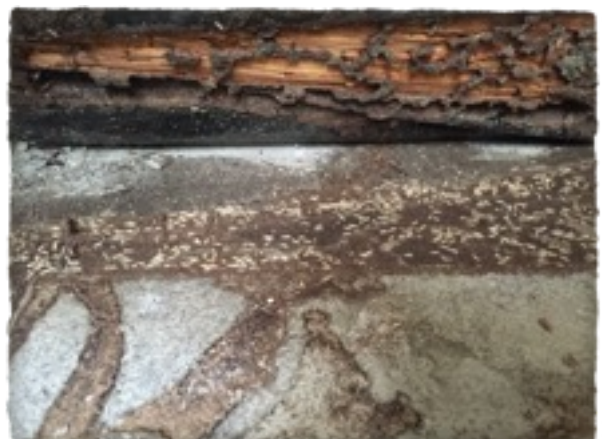
Autoroute dégât termites