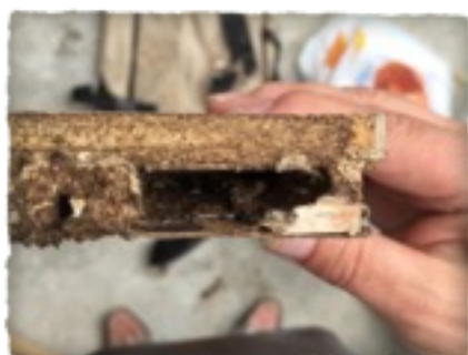
Dégât termites

Ils peuvent ainsi continuer leur travail de sape à l'abri des regards... jusqu'à destruction complète. Structures de la maison et équipements : rien ne leur résiste, y compris les matériaux qu'ils ne consomment pas, mais qu'ils traversent sans hésiter pour atteindre la cellulose dont ils sont friands. Ce n'est donc pas seulement le bois qu'ils endommagent, mais aussi le plâtre ou encore des gaines électriques ! Et tout cela à votre insu ! En toute logique, la lutte contre les termites doit donc se baser sur la prévention. Lorsque l'on réside dans une région termitée, il convient en effet d'anticiper leur arrivée. La méthode SENTRI TECH HD propose ainsi une surveillance active, avec élimination de la colonie dès le premier contact. Cette méthode, dure avec les termites et douce pour l'environnement, a pour avantage d'être infaillible et d'éviter tout dommage. Mieux vaut prévenir que guérir...