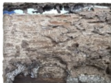
Dégât termites