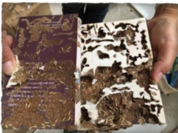
Dégât termites sur des livres

Au printemps, toute la nature se réveille, les termites après une période d'endormissement, prolifèrent. Petits insectes, grands dégâts. Les termites ne se cantonnent plus à leur habitat forestier. Ils s'attaquent aux arbres et aux maisons en toute discrétion pour causer de colossales dégradations...