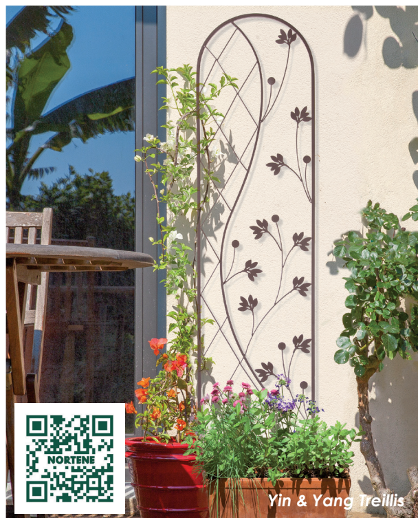
Yin & Yang Treillis