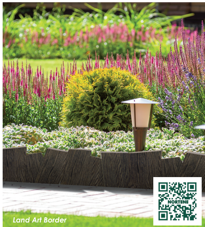
Land Art Border

Astuces : 4 bordures et vous obtenez un carré de plantation !