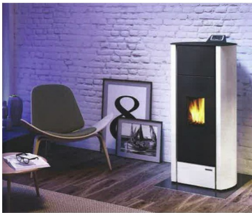
Poêle Cécile

Hexa, SCOP composée de 63 personnes, basée dans les Pays de la Loire depuis 1961, est spécialisée dans l'aménagement et la rénovation des intérieurs. Ses secteurs de prédilection sont la cuisine, la salle de bain, le dressing et l'équipement de cheminée, de poêle à pellets et/ou à bois. Les poêles mixtes à bois et à pellets demeurent les poêles les plus avantageux en termes d'économie, d'écologie et de confort. On trouve la gamme Ecofire® offrant une chaleur homogène, saine, programmable dans une ou plusieurs pièces avec un confort acoustique total. Si on monte en gamme, il y a toujours en exclusivité chez Hexa, les poêles combinés Max Blank® , le feu de pellets sans électricité est aussi beau que le feu de bois ! La dernière nouveauté, Confort + est un système de récupération et de distribution d'air chaud dans plusieurs pièces pour foyer fermé, poêle à bois ou à pellets.