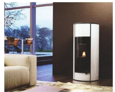
Poêle Ines

Les poêles combinés à bois ou à pellets fonctionnent sans ventilateur : la diffusion de la chaleur se fait par rayonnement et par convection naturelle. En effet grâce à l'échangeur de chaleur plus puissant, il a été possible d'obtenir un mouvement de convection naturelle sans l'aide du ventilateur, réduisant ce faisant les dépenses de courant électrique et en augmentant le confort acoustique.