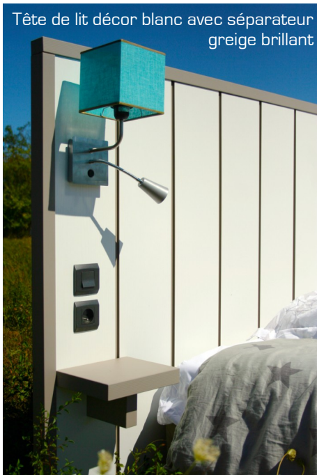
Tête de lit décor blanc avec séparateur greige brillant