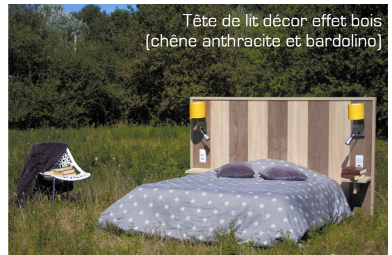
Tête de lit décor effet bois (chêne anthracite et bardolino)