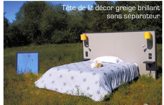
Tête de lit décor greige brillant sans séparateur