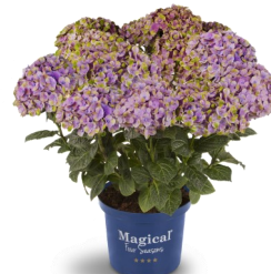
Magical Coral® bleu (existe en rose)