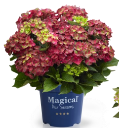
Magical Ruby Tuesday®