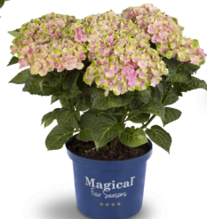
Magical Amethyst® rose (existe en bleu)