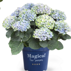
Magical Revolution® bleu (existe en rose)