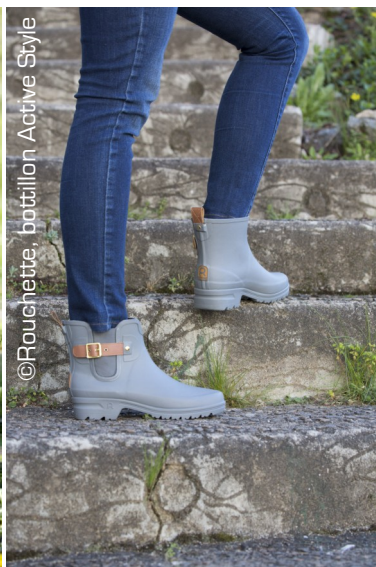
bottillon Active Style