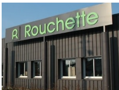
Rouchette ~ May-sur-Evre