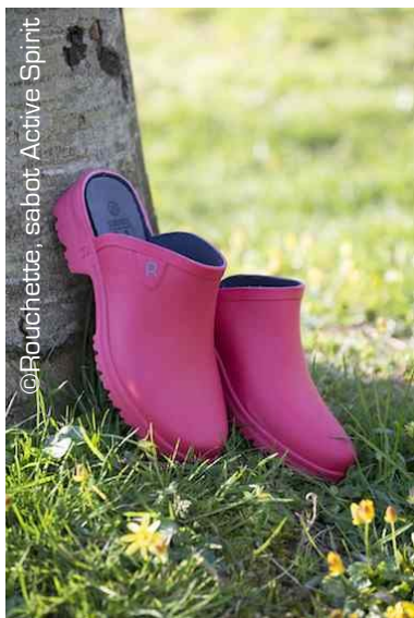
sabot Active Spirit