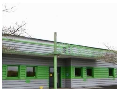
IDfer ~ Gesté

La nouvelle rubrique « Suggestion de thématiques » Par l'agence de relations presse Amsterdam Communication