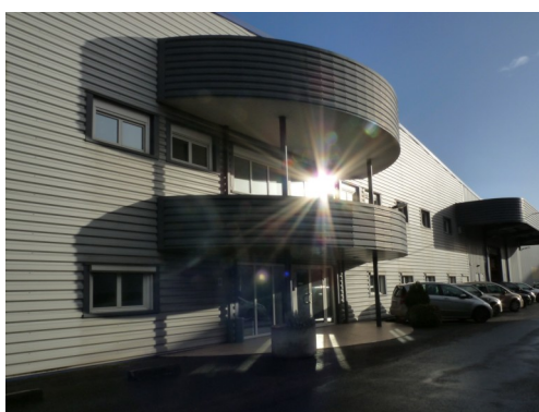
Discac ~ Lormont