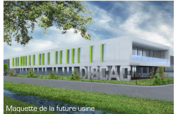
Maquette de la future usine