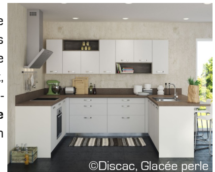
Glacée perle