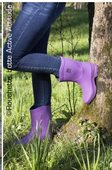
botte Active Attitude