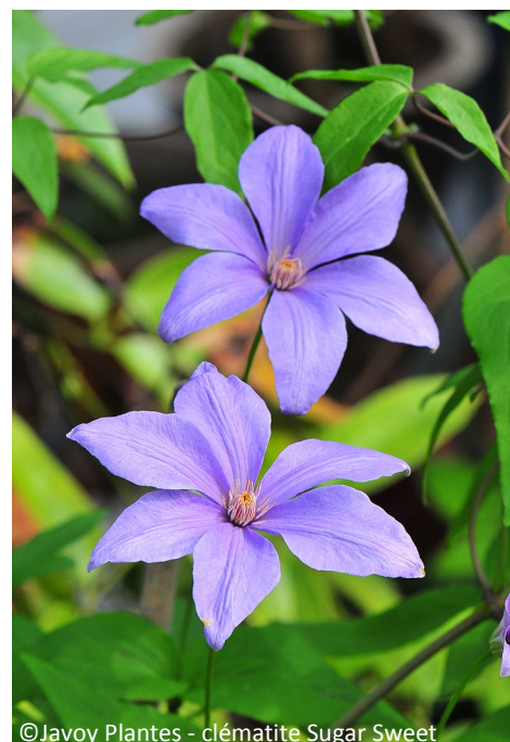
clématite Sugar Sweet