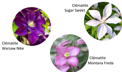
Clématite Warsaw Nike