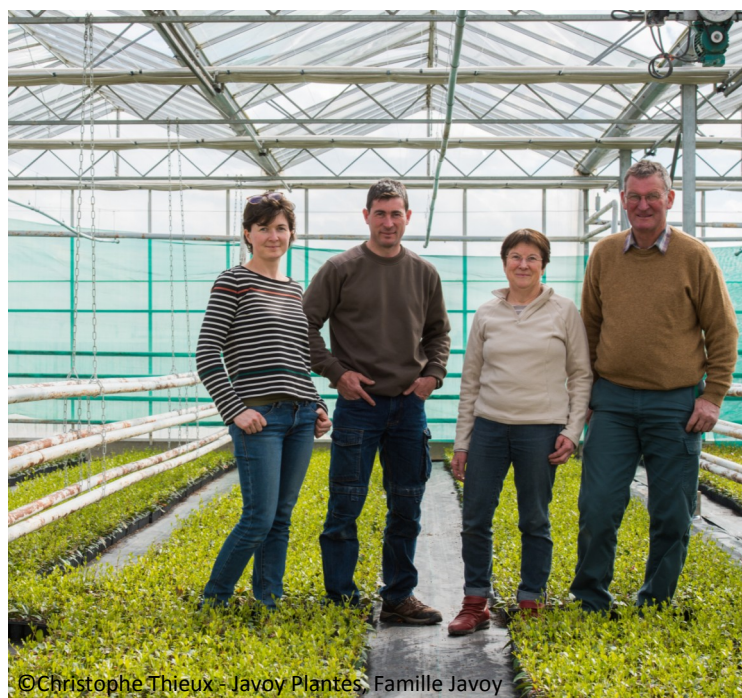
Javoy Plantes, Famille Javoy