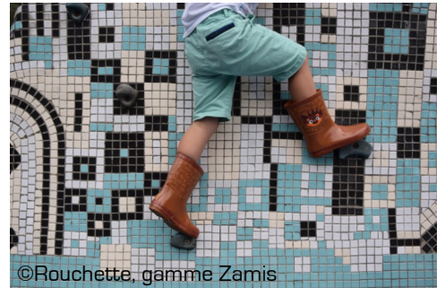
gamme Zamis