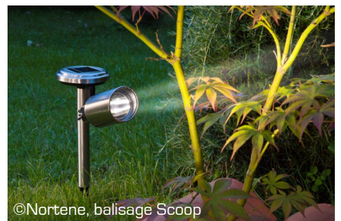
balisage Scoop