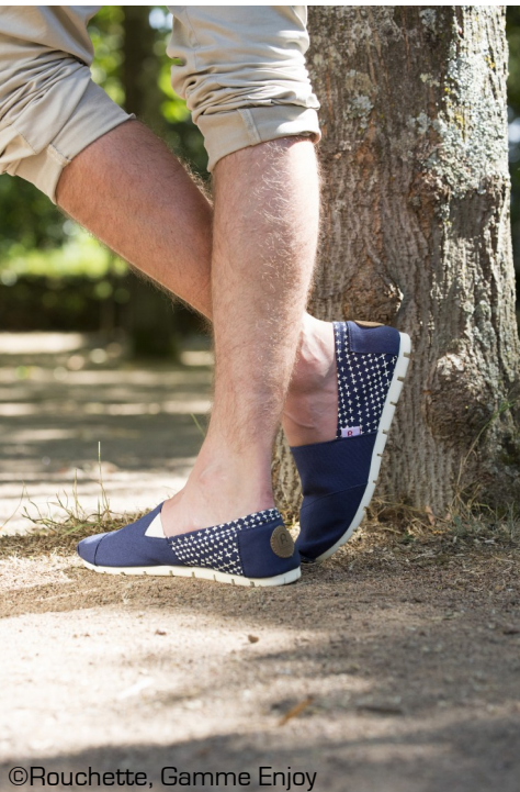
Gamme Enjoy