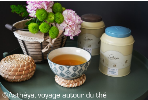
voyage autour du thé