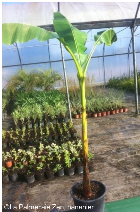
bananier