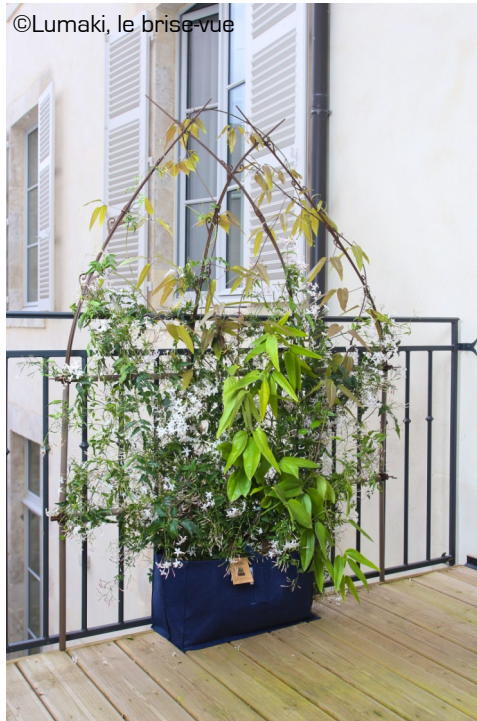
le brise-vue