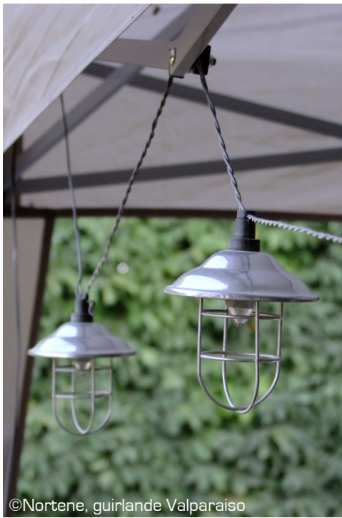
guirlande Valparaiso