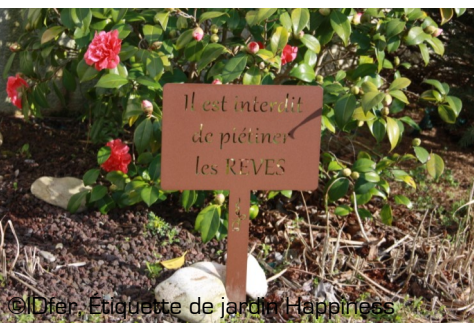
Etiquette de jardin Happiness