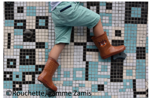
gamme Zamis