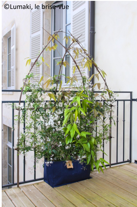
le brise-vue