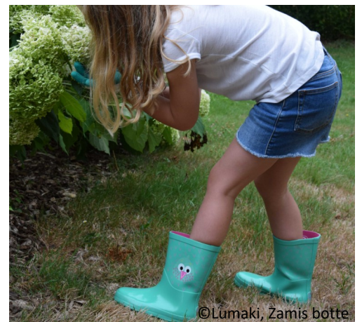
Zamis botte

Rouchette , société française basée au cœur des Mauges, est reconnue depuis deux générations comme la marque spécialiste du chaussant imperméable : bottes, bottillons, sabots. Les collections s'adressent à toute la famille , dans des contextes de loisirs pour les balades à la campagne ou en ville, le jardinage, la rando, à la mer et même au boulot. Rouchette marque cette année de son empreinte avec de nouveaux coloris printaniers , pour les petits et grands.