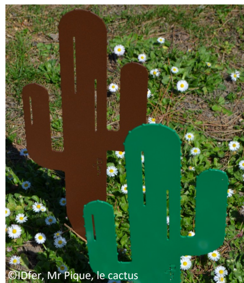
Mr Pique, le cactus

Le savoir faire d' IDfer , éditeur de meuble design en métal plié , repose sur le pliage et surtout la découpe par le laser d'une feuille de métal. Cette précision de la découpe laser est vertigineuse et permet à IDfer de créer des objets décoratifs personnalisables pour la maison et son extérieur : flamant rose Lady Pink, cactus Mr Pique ou étiquettes Happiness humoristiques à planter ; mais aussi du mobilier (tabouret, table...) pour équiper sa terrasse ou son salon.