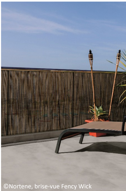
brise-vue Fancy Wick