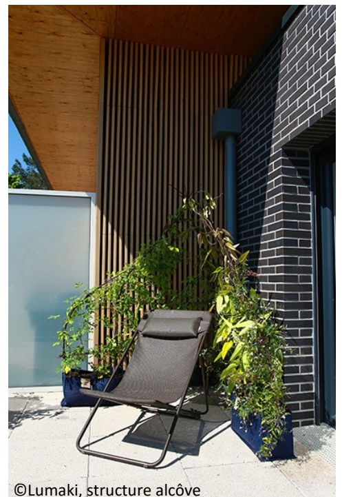
structure alcôve