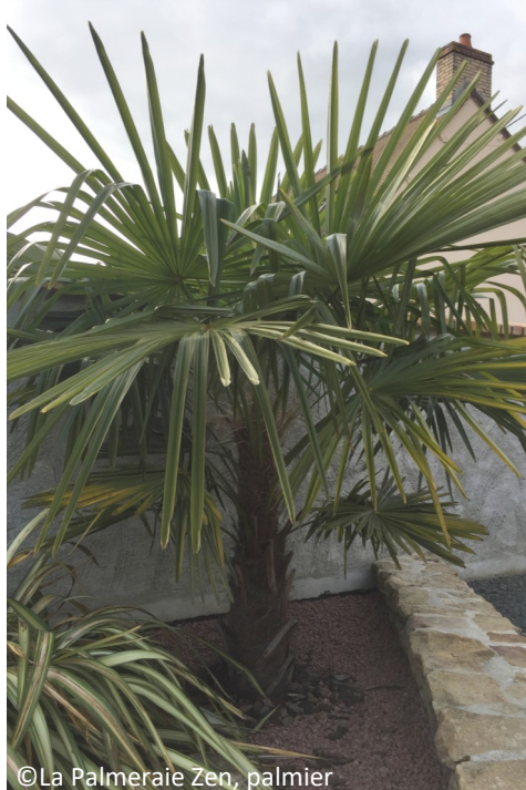
palmier