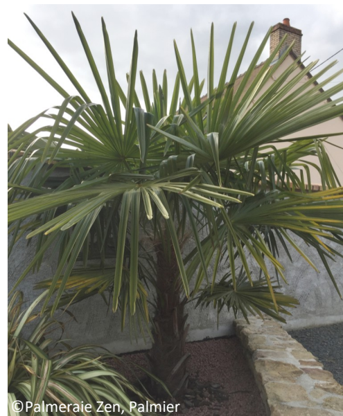
Palmier