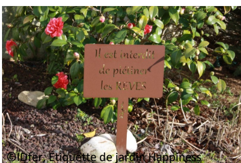
Etiquette de jardin Happiness