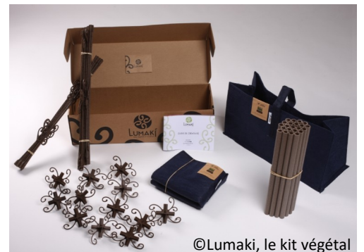
©Lumaki, le kit végétal

Lumaki est un concept DIY végétal qui rend accessible la végétalisation des petits espaces pour les citadins, tels que les balcons, terrasses et toits. Le kit comprend un coffret composé de tubes, de perches et de connecteurs pour créer la structure végétalisable de son choix (colonne, alcôve ou brise-vue). Ainsi qu'un duo de plantes grimpantes avec leur bac de plantation et un univers web avec des tutos vidéos, des idées DIY pour entretenir les plantes.