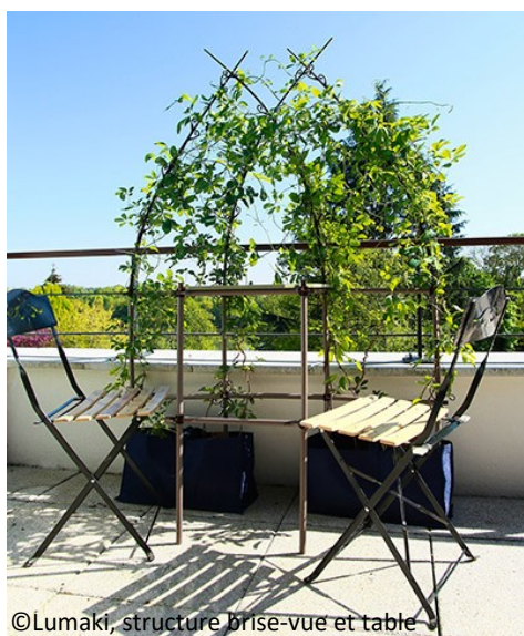
structure brise-vue et table

Journées presse d'Amsterdam Communication, action collective et collaborative de 6 marques spécialisées dans le milieu du jardin et son aménagement : Nortene, Rouchette, Idfer, Lumaki, La Palmeraie Zen et Asthéya.