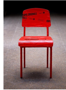
Copie originale du Studio 5.5

Se rendre à l'exposition pour découvrir le modèle Addict bleu – Ambiance dressing