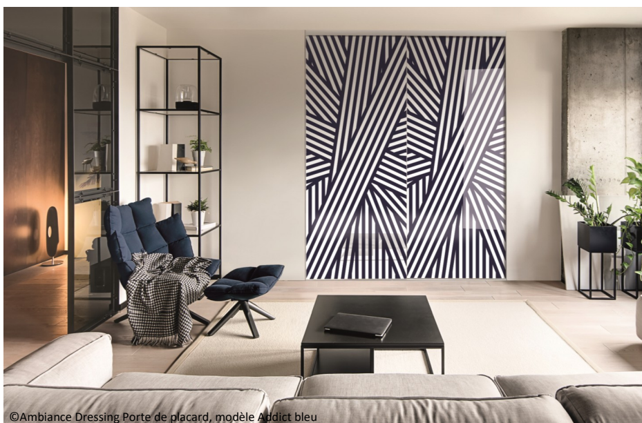
Porte de placard, modèle Addict bleu