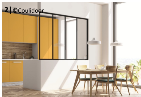
2 | @Couidoor

4 | Jade argent brillant, décor vert niagara.