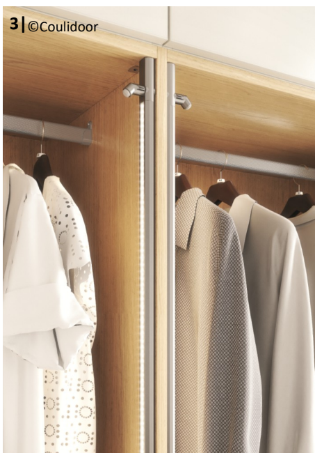
3 | @Couidoor

1 | Cézame argent mat, 3 vantaux vitre laquée cèdre, poignée cézame light.