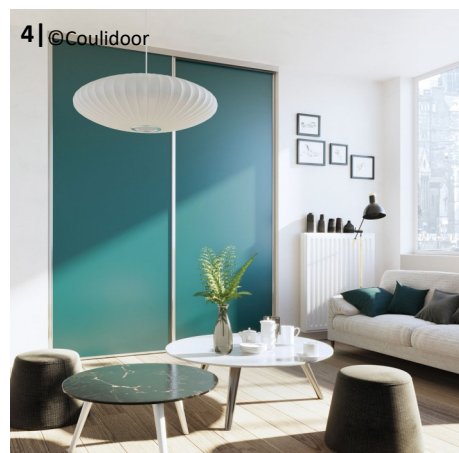
4 | @Couidoor

Pour plus d'informations : www.couidoor.fr