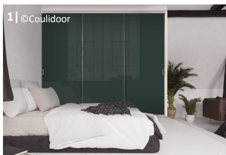
1 | @Couidoor

Découvrez la collection complète ICI ► Catalogue 2019-2021 ◀