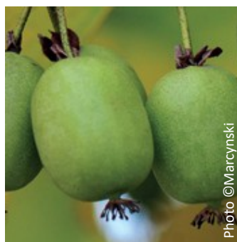
Kiwaï « Kokuwa » Autofertile Goût citron