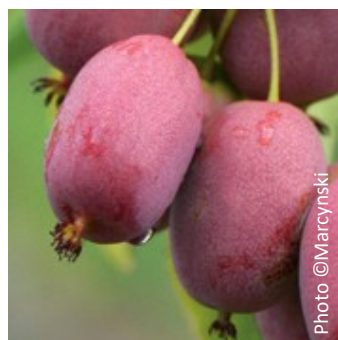
Kiwaï « Bingo » Femelle Goût ananas