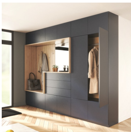
Rangement bleu foncé et gladstone sable avec miroir argent et système pousse-lâche