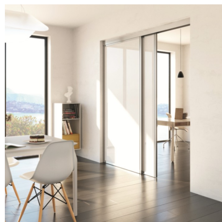
© Coulidoor, séparation de pièce modèle altitude intégrée 2 faces Recto blanc

Découvrez la nouvelle collection ICI ► Catalogue 2019-2021 ◀