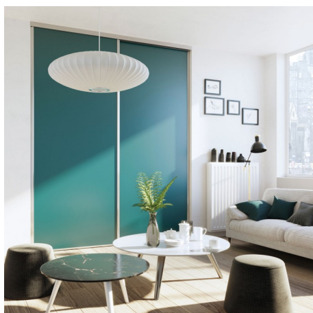
© Coulidoor, Porte de placard Jade argent brillant, décor vert niagara.

Les industriels du placard sur mesure présentent une offre d'une incroyable diversité, qu'il s'agisse de portes coulissantes, de portes pivotantes ou de séparations de pièce. L'essentiel de la production se concentre sur la fabrication de portes de placard pour 73 %, de rangements sur-mesure pour 23 %, et dans une moindre mesure de séparations de pièces, à hauteur de 4 %. (Enquête UNIFA - Source IPEA – 2014)