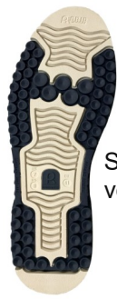
Système de ventouse (bleue)