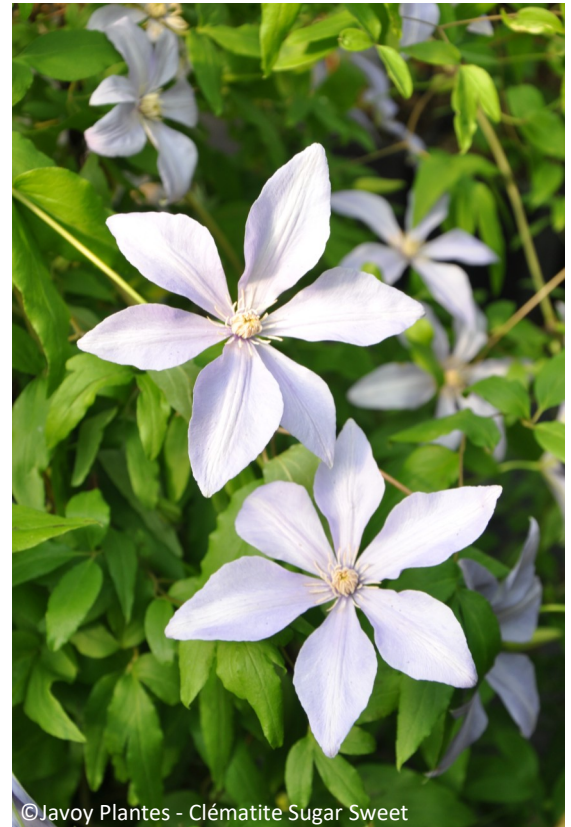
Clématite Sugar Sweet

Récompensée au « Chelsea Flower Show 2019 ».