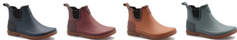
Coloris Bleu canard