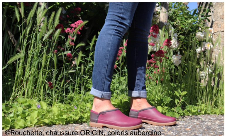
chaussure ORIGIN, coloris aubergine

Rouchette , marque reconnue en matière de chaussant imperméable , depuis 30 ans, se positionne parmi les concepteurs français de botte de jardin en caoutchouc . Grâce à cette notoriété, Rouchette ambitionne de faire plus que des chaussants en s'impliquant comme une marque engagée dans la protection de l'environnement et actrice dans ses actes. Comment ? Rouchette s'est rapprochée de l'association Reforest'Action : les deux partenaires se sont réunis pour lancer une opération spéciale de reforestation dans les zones impactées par la déforestation « je plante ma forêt – en achetant un produit de la gamme Origin , je contribue à planter des arbres » car la forêt est la meilleure solution pour le climat et la biodiversité. L'opération a été lancée depuis janvier 2020, la nouvelle gamme à ce titre a été créée, ORIGIN , comme support de son empreinte environnementale.