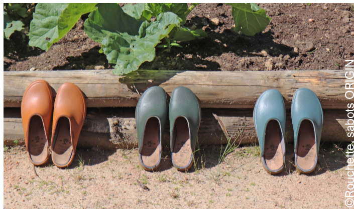
Coloris Vert d'eau