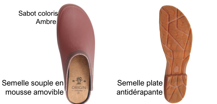
Sabot coloris Ambre

Elle offre un confort de marche grâce à la semelle souple amortissante , semelle intérieure est en mousse amovible. Elle est composée majoritairement de caoutchouc naturel, durable : Rouchette a développé un packaging en carton recyclé et 100% recyclable , sans plastique.