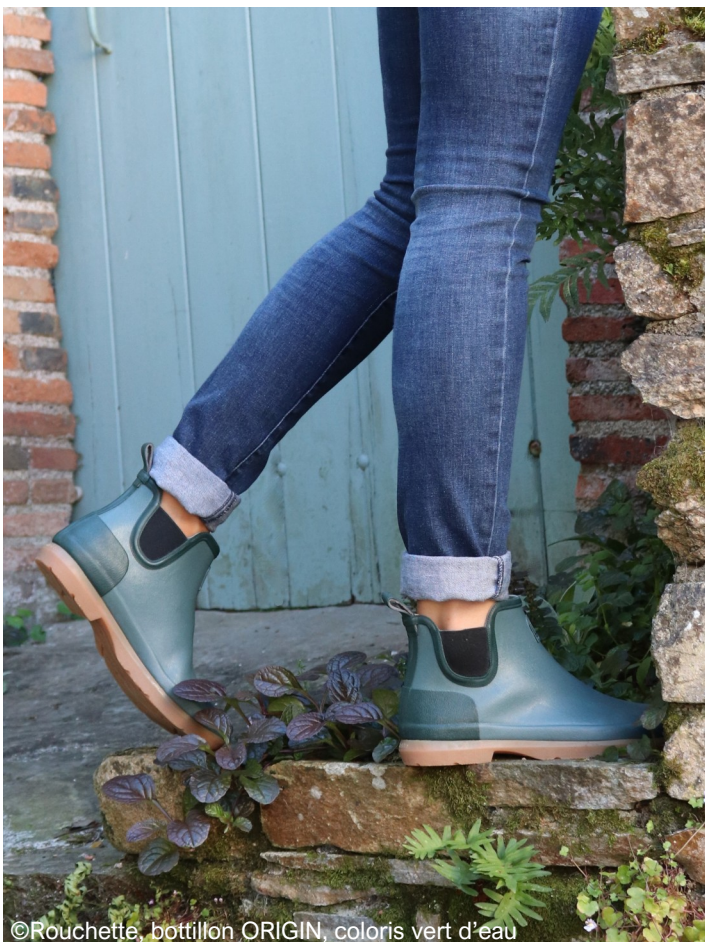
bottillon ORIGIN, coloris vert d'eau