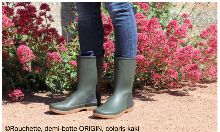
©Rouchette, demi-botte ORIGIN, coloris kaki