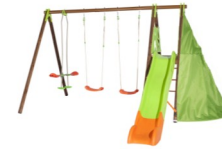
Station de jeux Navajo