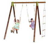
Station de jeux Xylo