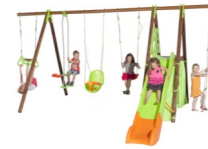
Station de jeux Legato