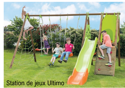
Station de jeux Ultimo

Uniques en France, ces portiques à géométrie variable , qui allient le bois et le métal , sont reconnus comme étant des produits qualitatifs, sécurisants et esthétiques : la gamme Techwood est la gamme phare chez Trigano Jardin. Pour les concevoir, Trigano Jardin dispose d'un service recherche et développement qui permet d'être au plus près des attentes des clients, notamment en matière de sécurité.