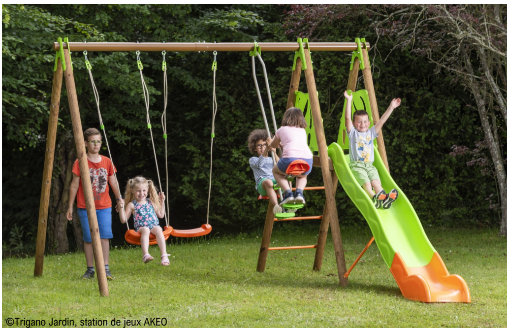
station de jeux AKEO