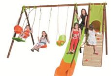
Station de jeux Kempro