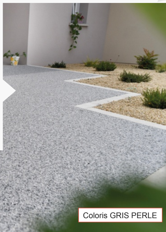
Coloris GRIS PERLE

La nouvelle palette de couleurs laisse libre court à la créativité du client et permet de personnaliser ses extérieurs à son image : on sait tous que la décoration extérieure est le prolongement de la décoration de l'habitat. La finition brillante apporte une touche de modernité qui donne un rendu très propre et très esthétique . La palette de couleur compte 8 coloris : gris perle, corail, soleil, dune, ivoire, nuage, basalte, écorce. Le client peut s'exprimer.