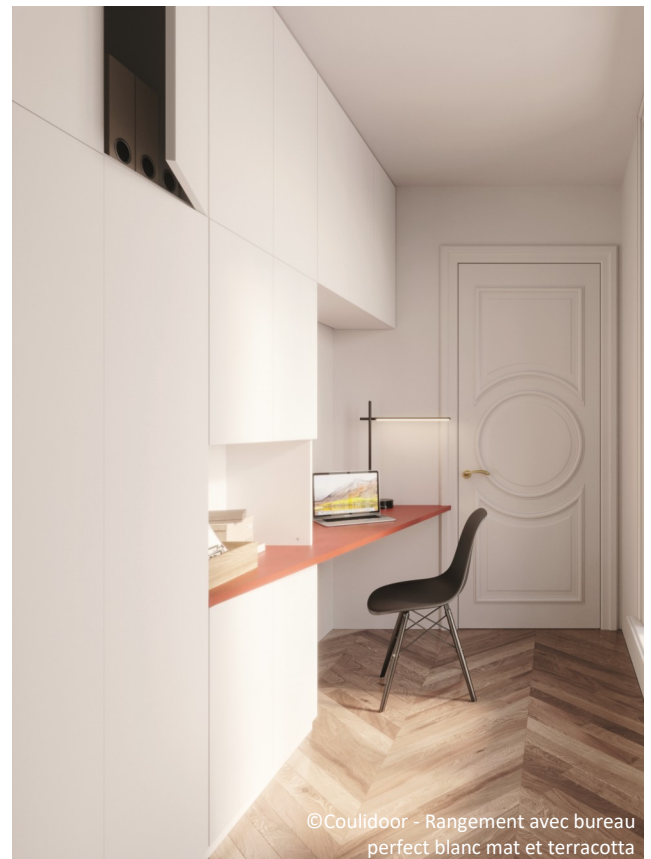
©Couldoor - Rangement avec bureau perfect blanc mat et terracotta

Couldoor , fabricant français de portes de placard, dressings, séparations de pièce, élargit son champs d'action aux autres pièces de la maison : cave, buanderie, sous-escaliers, couloir... Ces espaces souvent perçus comme espaces perdus par manque d'aménagement, Couldoor a imaginé des solutions qui répondent aux besoins de toute la famille. Repenser les petites pièces annexes va contribuer à apporter plus de confort au quotidien . Pour offrir des rangements fonctionnels et astucieux dans des volumes exigus, le fabricant doit faire preuve d'adaptabilité. La force de Couldoor, le sur-mesure , prend dans ces cas de figure tout son sens.