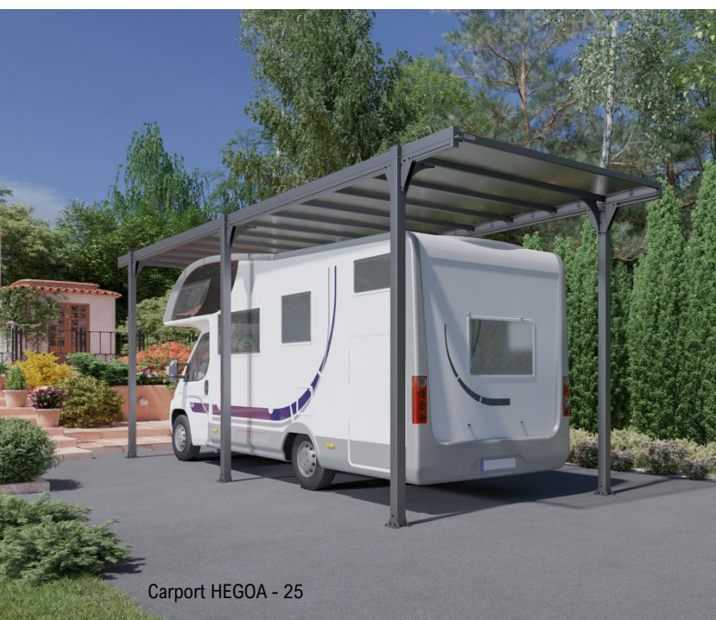
Carport HEGOA - 25

A découvrir du 25 septembre au 3 octobre 2021 au salon des véhicules de loisirs, au parc des expositions Paris Le Bourget.