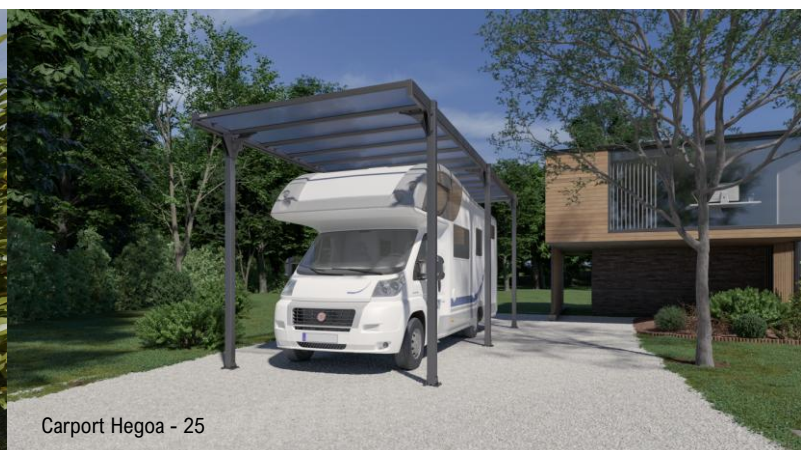
Carport Hegoa - 25