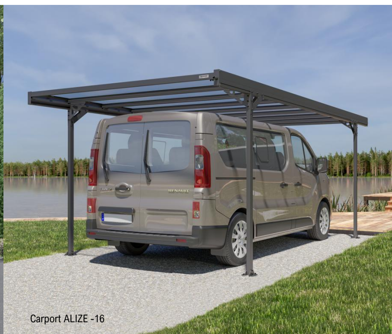
Carport ALIZE - 16

Trigano Jardin , filiale du célèbre groupe Trigano, est spécialisée dans les équipements des extérieurs de la maison avec 4 familles de produits : les abris de jardin, les piscines hors-sol, les jeux de plein air et depuis 2018 les carports. En septembre, 3 nouveaux modèles de carports XL , dédiés aux véhicules grands formats , seront présentés pour la 1 ère fois au salon des véhicules de loisirs au parc des expositions Paris Le Bourget du 25 septembre au 3 octobre. Les filiales du groupe Trigano unissent leurs intérêts autour de chaque savoir-faire , le temps du salon. Cette gamme de carports a un atout majeur qui ne peut que séduire les visiteurs : leur fabrication est d'origine France garantie , au cœur du Vendômois, en région Centre.