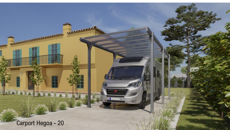
Carport Hegoa - 20