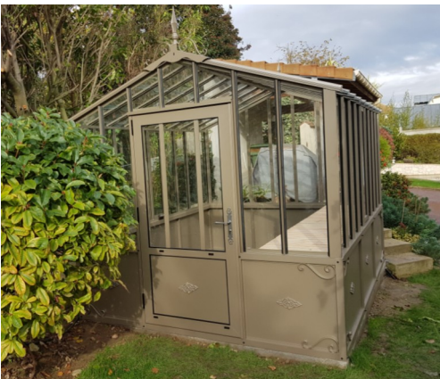
Joséphine soubassement