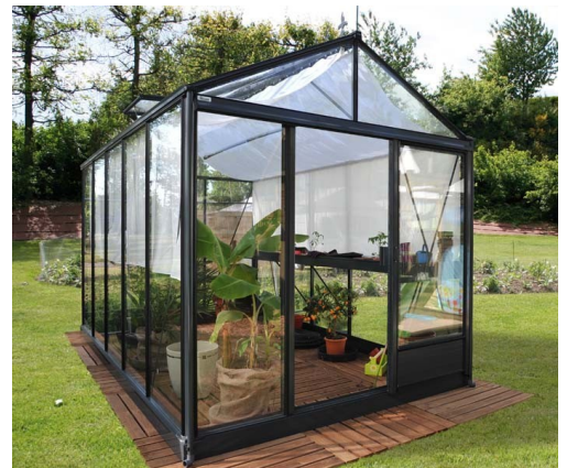
©L'Atelier des Serres - Euro Maxi laquée

Pour plus d'informations : www.latelier-des-serres.com