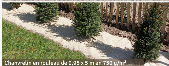
Chanvrelin en rouleau de 0,95 x 5 m en 750 g/m 2