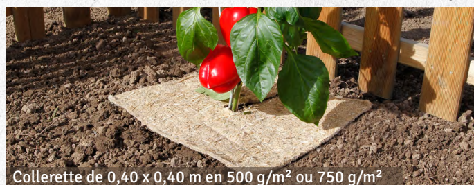
Collerette de 0,40 x 0,40 m en 500 g/m 2 ou 750 g/m 2

Plusieurs formats au choix avec 2 grammages différents (500 g/m 2 ou 750 g/m 2 ) :