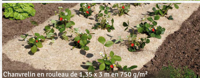
Chanvrelin en rouleau de 1,35 x 3 m en 750 g/m 2

Prix public généralement constaté : de 5 euros à 35 euros selon le modèle.