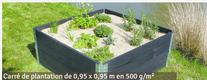
Carré de plantation de 0,95 x 0,95 m en 500 g/m 2