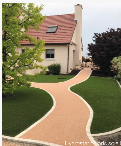
Hydrostar coloris soleil