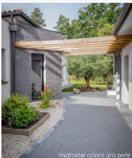
Hydrostar coloris gris perle

Prix public généralement constaté : à partir de 126 €/m 2 (fourniture et pose comprise)