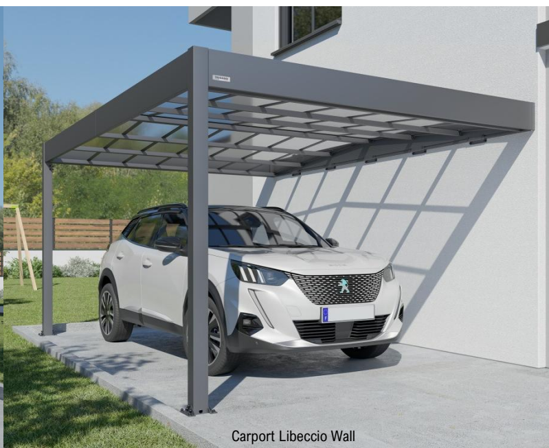
Carport Libeccio Wall

Trigano Jardin , filiale du célèbre groupe Trigano, est spécialisée dans les équipements des extérieurs de la maison avec 4 familles de produits : les abris de jardin, les piscines hors-sol, les jeux de plein air et depuis 2018, les carports. La gamme complète de carports pour voiture est présentée pour la 1 ère fois au salon Paysalia à Eurexpo Lyon-Chassieu du 30 novembre au 2 décembre . La filiale du groupe Trigano vient à la rencontre des professionnels du paysage , afin d'élargir son marché jusqu'ici réservé aux particuliers. Cette gamme de carports a un atout majeur qui ne peut que séduire les paysagistes : leur fabrication est certifiée Origine France Garantie , au coeur du Vendômois, en région Centre.