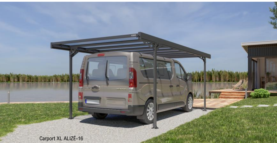
Carport XL ALIZÉ-16

À découvrir du 24 septembre au 2 octobre 2022 au salon des Véhicules De Loisirs, au Parc des Expositions Paris Le Bourget.