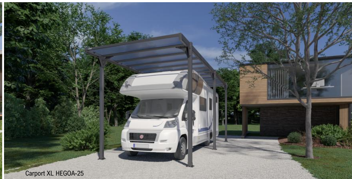
Carport XL HEGOA-25